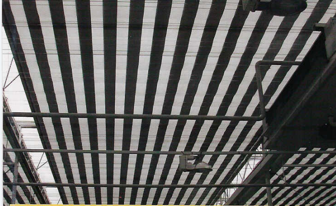
Bij sluiting van het Diafragma-scherm liggen de transparante en aluminium stroken precies op elkaar. Dit geeft (ruim) 50% scherming (foto: Leen Huisman BV).

Inspeland op nieuwe kasconcepten, dito teeltwijzen en de wens om flexibel en efficiënt te kunnen schermen, hebben de afgelopen jaren diverse nieuwe schermssystemen het licht gezien. Praktijkproeven met het Diafragma-scherm van Leen Huisman en het Klimrek Scherm laten veelbelovende resultaten zien. Ook het ACL-scherm van Meteor Systems biedt perspectief nu de aanvankelijke problemen overkomen lijken.